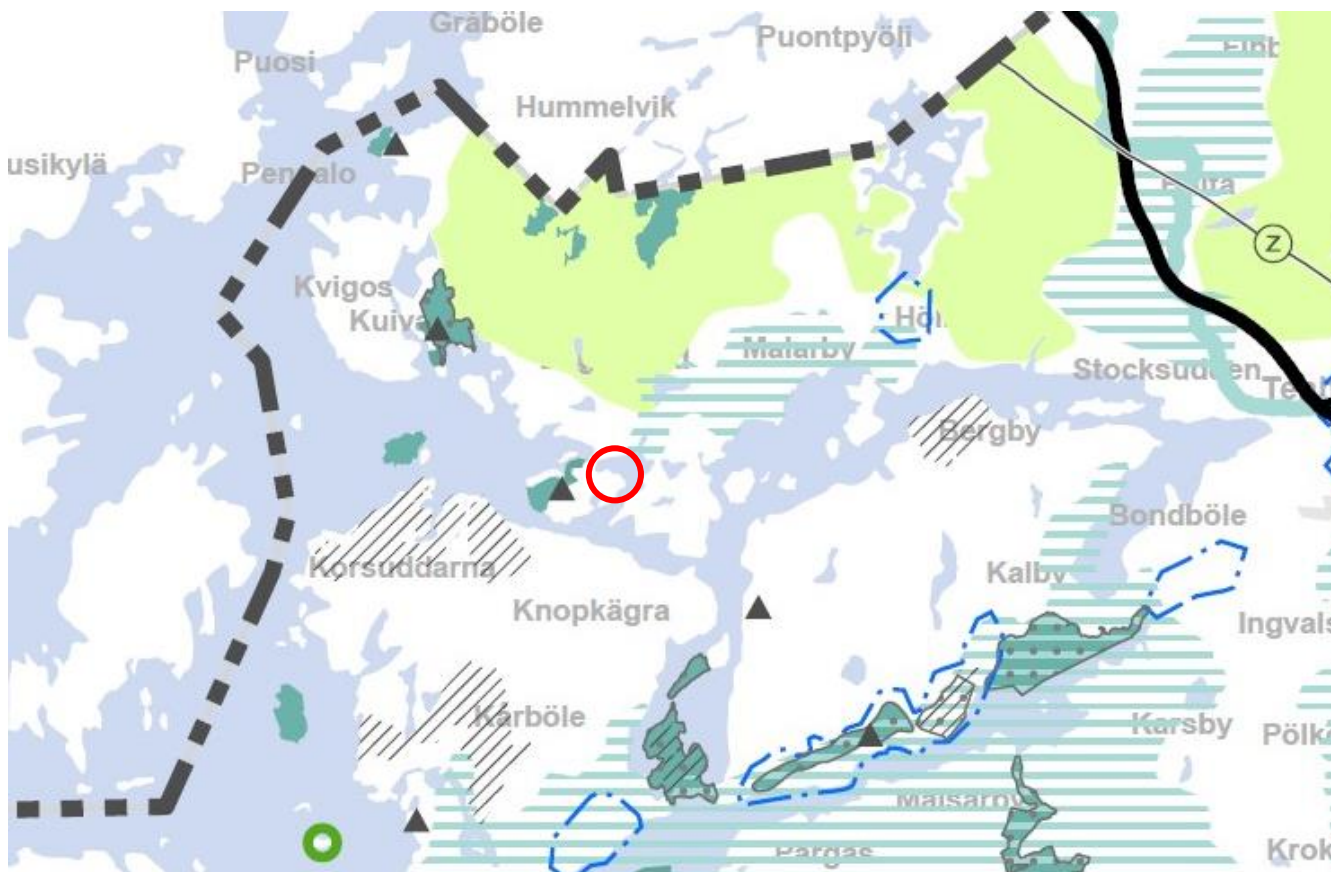
Bild 3. Sammanställning av landskapsplanen

Suunnittelualueelle ei kohdistu vahvistettujen maakuntakaavojen yhdistelmässä merkintöjä tai määräyksiä.