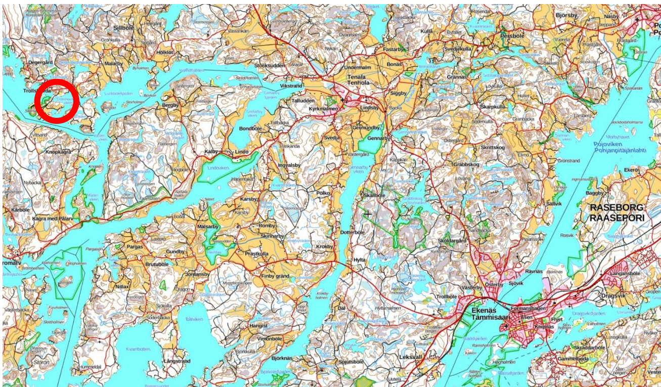
Bild 1. Planområdets läge