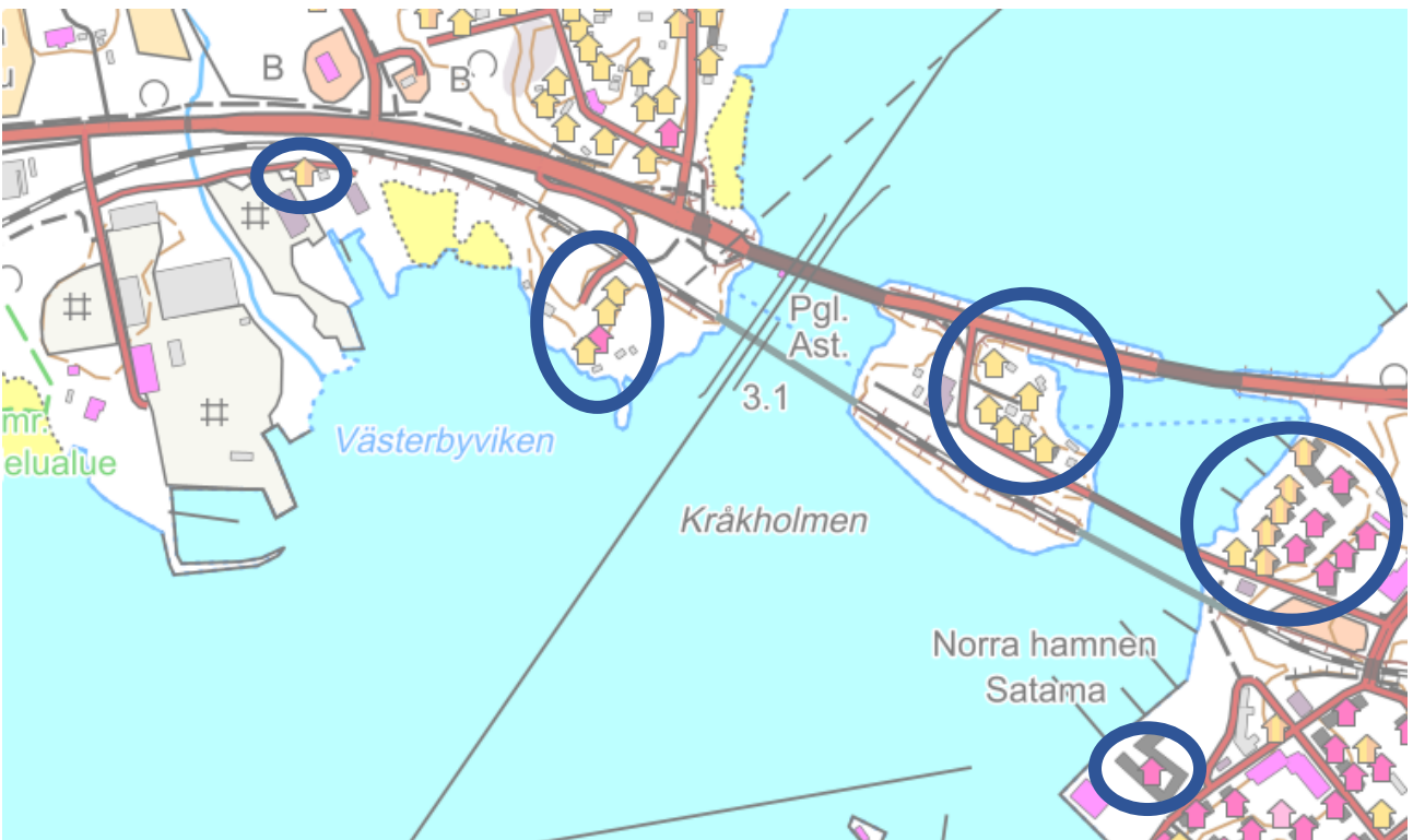
Kartta 2: Häiriintyvät kohteet, joille on jaettava tiedote.