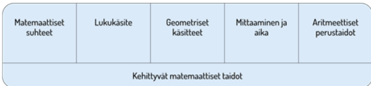
Kuvio 2: Lasten matemaattisen kehityksen keskeiset osa-alueet esiopetuksessa.

Lapsia innostetaan pohtimaan ja kuvailemaan matemaattisia havaintojaan erilaisissa arjen tilanteissa opettajan mallintamisen ja kielellistämisen avulla. Lapsia innostetaan jakamaan toisilleen havaintojaan ja syventämään sitä kautta yhteistä ajattelua, ongelmanratkaisutaitoja ja toimintaa. Toiminta suunnitellaan niin, että se tarjoaa lapselle mahdollisuuksia opetella ja käyttää matemaattisia käsitteitä, luokitella, vertailla, asettaa järjestykseen asioita ja esineitä sekä löytää ja tuottaa säännönmukaisuuksia. Opetukseen kuuluu muistia ja loogista ajattelua kehittäviä leikkejä ja tehtäviä. Opetus on leikkilistä ja siinä hyödynnetään leikkejä, pelejä ja tarinoita sekä tieto- ja viestintäteknologiaa.