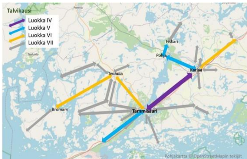
Bild 1 - Myndighetsområde och stomlinjenätet i färg