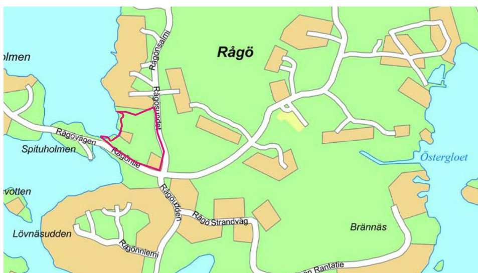
Planeringsområdet markerat med röd linje

Planområdet är beläget i Ekenäs skärgård på Rågös västra strand. Området omfattas av fastighet RN:r 4:81 (710-443-4-81) samt del av fastighet 4:137 (710-443-4-137) i Rågö by. Områdets areal är ca 2,1 ha.