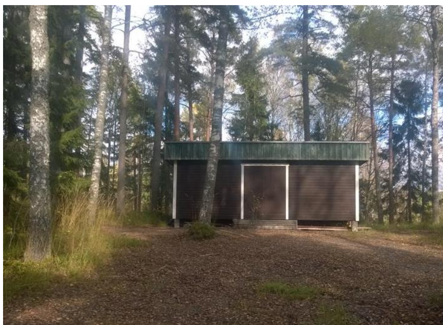
Bild 2. Nuvarande servicebyggnad.

Planområdets näromgivning är huvudsakligen utbyggd enligt den gällande stranddetaljplanen. Vid stranden på området för gemensamt bruk finns en bastu med brygga och lite längre bort från stranden en tennisplan. Inom kvarteret för gemensamma servicebyggnader har uppförts en servicebyggnad på ca 42 v-m 2 och en delvis täckt grillplats är placerad i närheten av den gemensamma bastun. Servicebyggnaden och grillplatsen rivs i samband med ändringen av planen och byggandet av fritidsbostäderna. Utanför området, på andra sidan av vägkorsningen vid kvarterets sydöstra hörn, är områdets sopcontainer placerad.