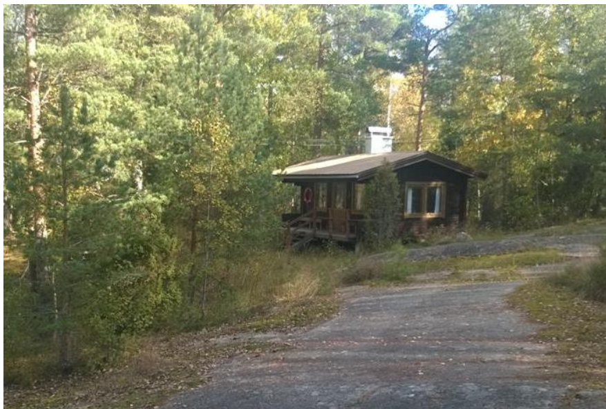
Bild 4. Den gemensamma strandbastun.