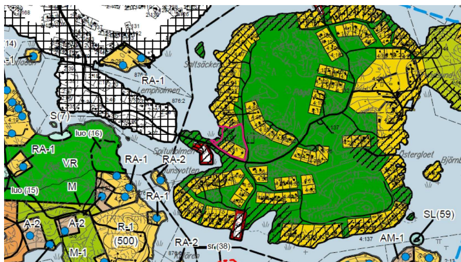
Utdrag ur östra skärgårdens generalplan. Planeringsområdet markerat med röd linje

På området gäller delgeneralplanen för Ekenäs östra skärgård som är godkänd 3.11.2008 och fått lagakraft 2009. Området har i delgeneralplanen noterats som område med gällande stranddetaljplan.