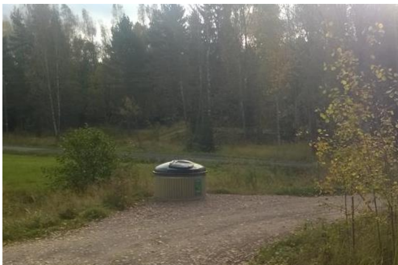
Bild 6. Områdets sopcontainer på andra sidan vägen.