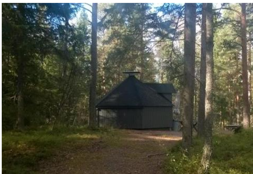
Bild 3. Grillplatsen