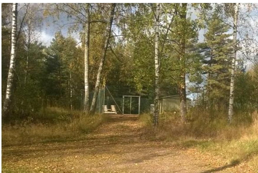
Bild 5. Mot tennisplanens port.