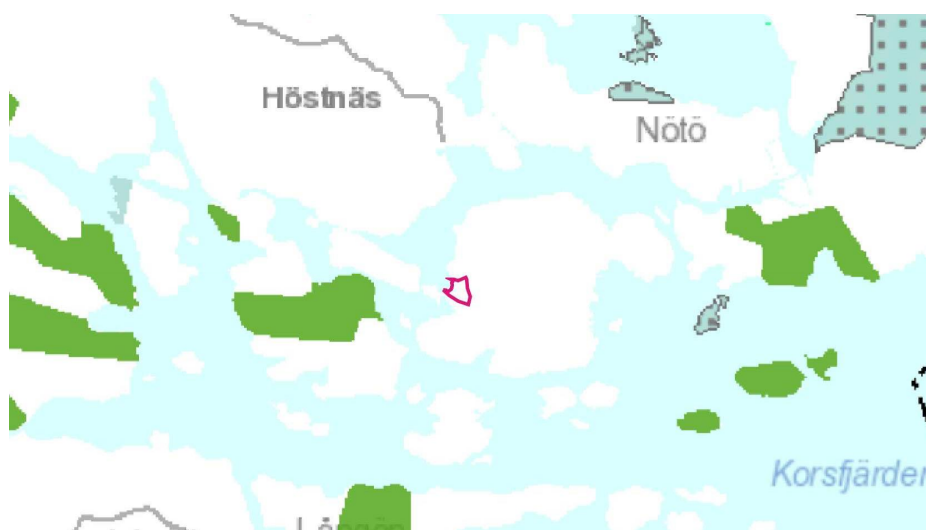
Utdrag ur sammanställning av de fastställda landskapsplanerna 2014, etapplandskap 1-3. Planeringsområdet markerat med röd linje.

Beredningen av Nylands fjärde etapplandskapsplan är på gång. Planens syfte är att stöda hållbar konkurrenskraft och välmående inom Nyland. Den fjärde faslandskapsplanen kommer att vara mer strategisk än de tidigare landskapsplanerna. Sakområden som kommer att beröras är näringsformerna och innovationsverksamhet, logistik, vindkraft, grönstrukturer och kulturmiljöer. Ett utkast av landskapsplanen har varit till påseende i början av år 2015.