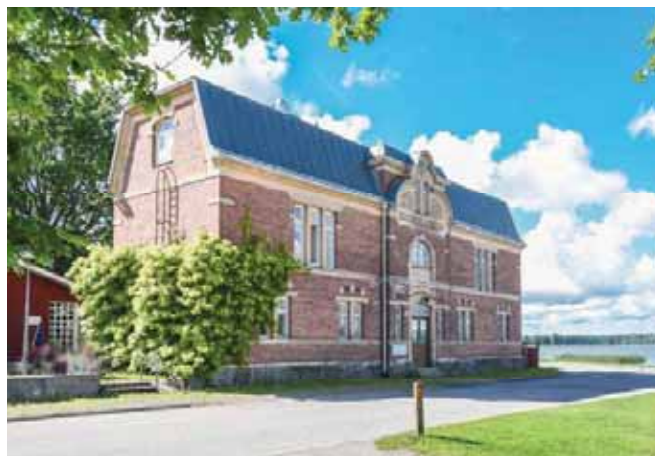
Gamla Bastun / Vanha sauna

Entinen kylpylärakennus (ns. vanha sauna) on vuonna 1903 rakennettu 550 m 2 tiilirakennus, joka on aiemmin toiminut yleisenä saunana, kerhotilana ja ateljeena.