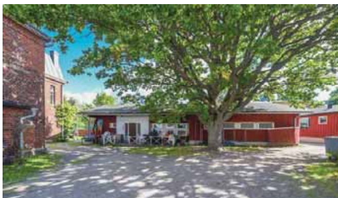
Nya bastun / Uusi sauna