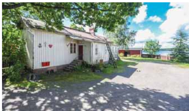
Bostadhuset / Asuinrakennus