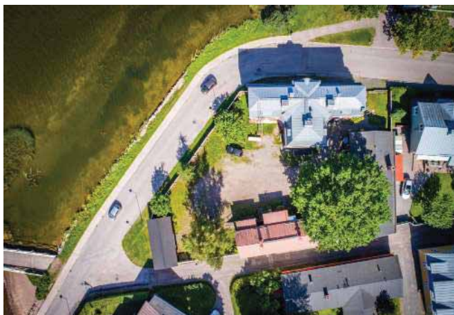
Flygfoto / Ilmakuva

Fd. badinrättning (sk.Gamla Bastun) är en tegelbyggnad om 550 m 2 . Den uppfördes år 1903 och har tidigare fungerat som allmän bastu, klubblokal och ateljé.