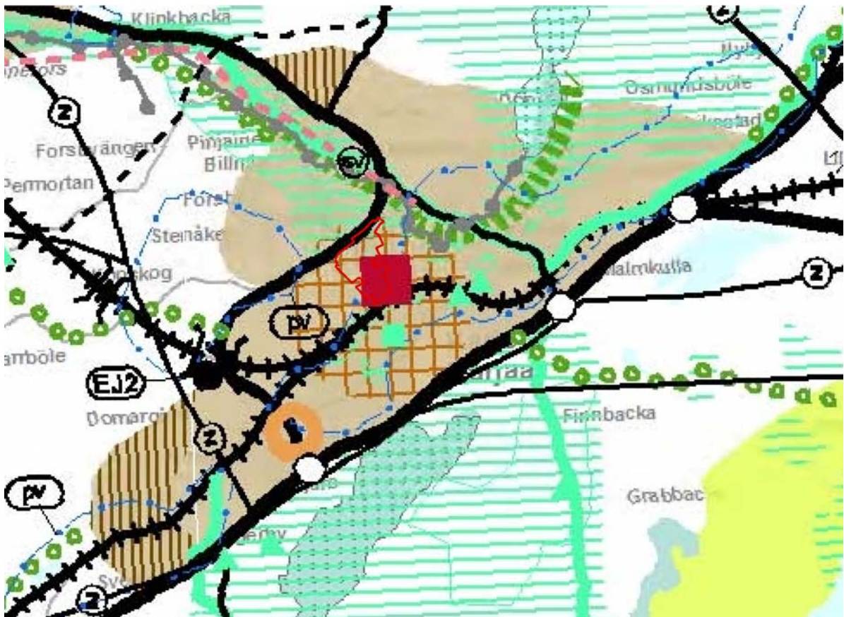
Bild 1. Utdrag ur landskapsplanssammanställning för Nyland. Planeringsområdet avgränsat med röd färg.

Beteckningen för centrumfunktioner har i etapplandskapsplanen 2 upphävts och ersatts av en ny beteckning för centrumfunktioner som möjliggör placeringen av totalt 30 000 v-m2 storeheter av detaljhandel på Karis centrumområde. Beteckningen för ett område som ska förtätas har lagts till i etapplandskapsplanen gällande Karis centrumområde. Planområdet ligger i sin helhet på detta område. Beteckningen för ett område som ska förtätas anvisas för en tätort som stöder sig på hållbart trafiksystem. Området ska utvecklas effektivare än andra områden på tätorten och så att den stöds av kollektivtrafik, gång- och cykeltrafik.