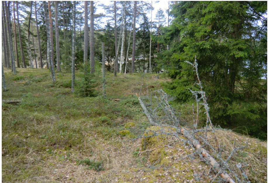
Sisäosistaan niemi on tavanomainen.