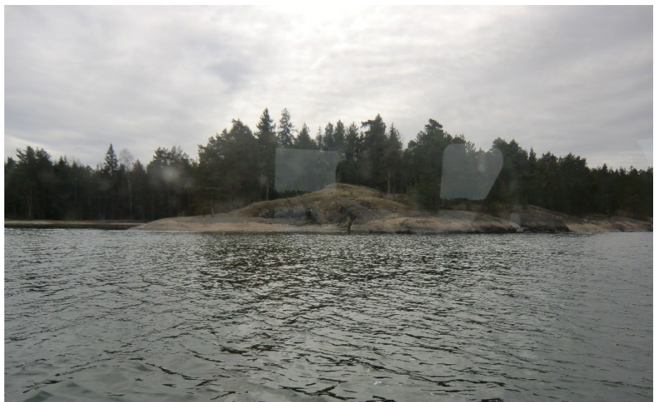
Näkymä mereltä käsin.