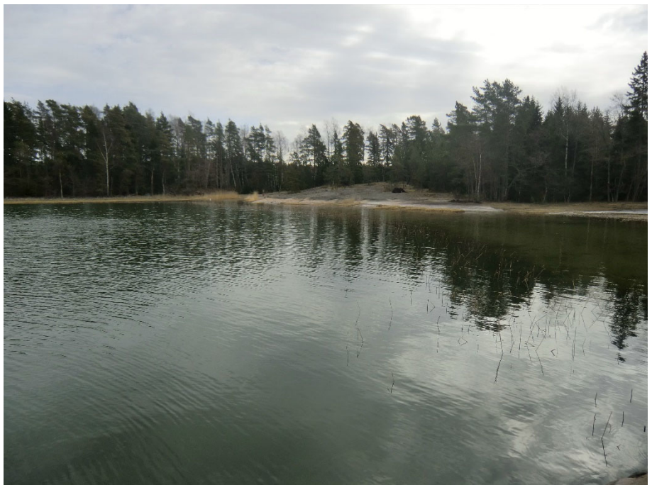
Silokallio etäämpää nähtynä.