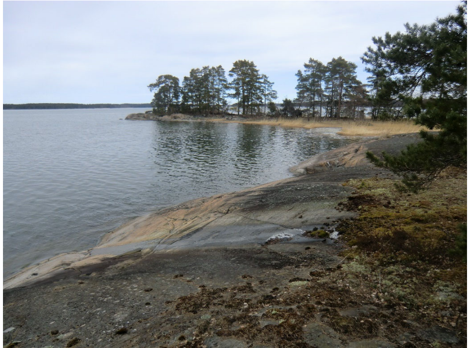
Ryssvikuddenin kapein kärki.

Muulta osin niemi ei ole maisemallisesti erityisen poikkeuksellinen. Pohjoinen rantakallioalue on varsin hieno. Idän puolella oleva kalliolaki, joka on niemen korkein kohta, näkyy mereltä koillisen suunnalta aluetta lähestyessä. Länteen suuntautuva, osin tervalepystä koostuva, rantapuusto on maisemallisesti varsin viehättävä. Niemen sisäosat puolestaan ovat hyvinkin tavanomaiset. Lähimaiseman osalta niillä ei ole perusteita maisemalliseksi arvokohteeksi. Puuston laajamittaisella kaatamisella voi kuitenkin olla kauas näkyviä seurauksia.