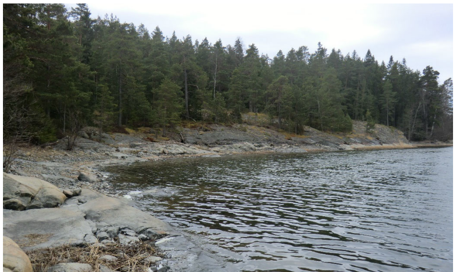
Rakennuspaikalla on paljon puustoa.