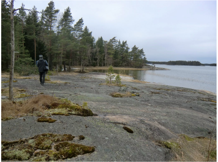
Rakennuspaikalla oleva hieno silokallio.